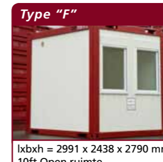
lxbxh = 2991 x 2438 x 2790 mm 10ft Open ruimte

lxbxh = 6055 x 2435 x 2790 / 2590 mm 20ft Open ruimte