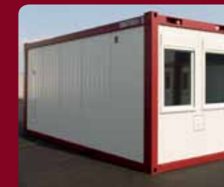
20ft Open ruimte, 2.80 hoog