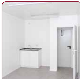
Binnenzijde met keukenblok

lxbxh = 6058 x 2990 x 2820 mm Open ruimte.