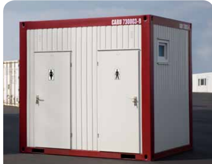
10ft sanitair "dames / heren"

Het productgamma in de sanitairuitvoering bestaat uit verschillende typen en afmetingen. Toepassingen die geschikt zijn voor (grootschalige) evenementen of bouwplaatsinrichting. Beschikbaar in de gescheiden dames/herenuitvoering en alleen herenuitvoering.