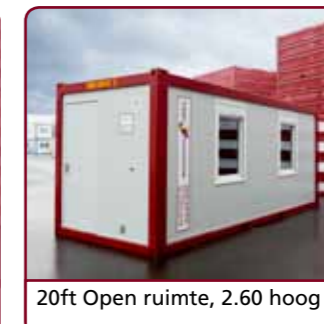
20ft Open ruimte, 2.60 hoog