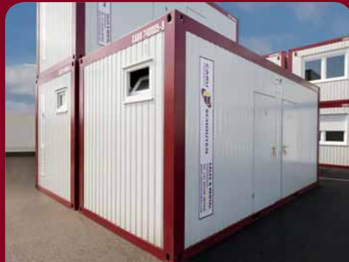
20ft sanitair "dames / heren"