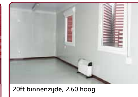
20ft binnenzijde, 2.60 hoog