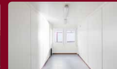
20ft binnenzijde, 2.80 hoog